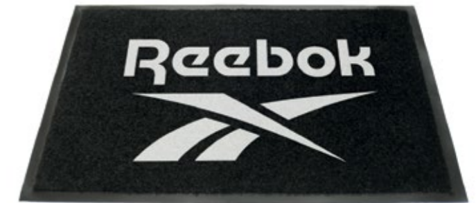
LOGO MAT RBMAT Dimensions: 60 cm x 90 cm