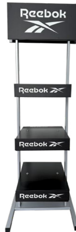
LOGO STAND RBSTAND Ecofriendly Display Dimensions: 50 cm x 160 cm x 50 cm