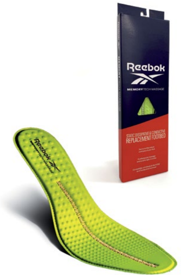
FOOTBED RBMT Removable Cushion Footbed for ESD and Conductive Footwear Fluorescent Green