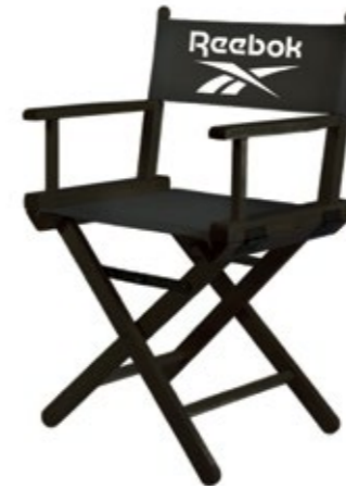
LOGO CHAIR RBCHAIR Dimensions: 49 cm x 72 cm x 34 cm