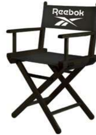
LOGO CHAIR RBCHAIR Dimensions: 49 cm x 72 cm x 34 cm