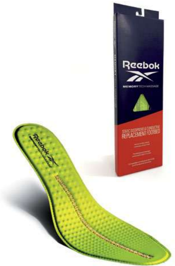
FOOTBED RBMT Removable Cushion Footbed for ESD and Conductive Footwear Fluorescent Green