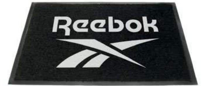
LOGO MAT RBMAT Dimensions: 60 cm x 90 cm