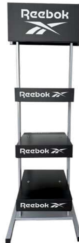
LOGO STAND RBSTAND Ecofriendly Display Dimensions: 50 cm x 160 cm x 50 cm